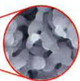
ミクロポア (2 \mu m以下)