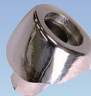
カスタムマグネット