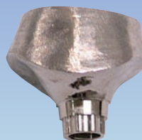
EL インプラント レギュラープラットフォーム