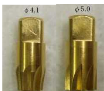
(セットスクリュー附属)

Type "Pro" の2次手術時に、インプラントのプラットホーム上の余分な周囲骨を取り除くためのツールです。