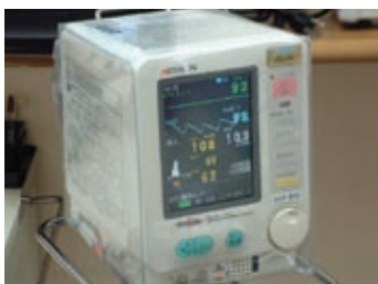
血圧、脈拍や血中酸素量の確認