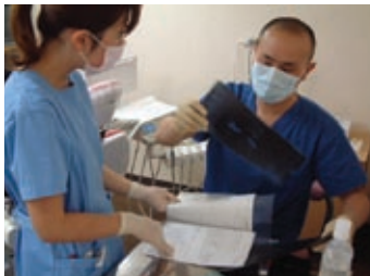
資料の準備と術前のミーティング