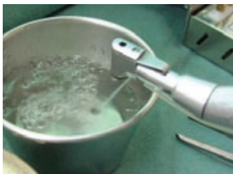
エンジンの作動確認