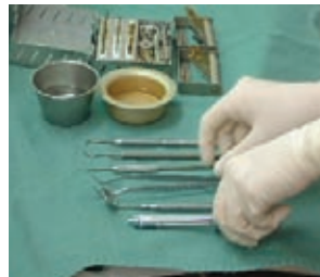
器具・器材の準備