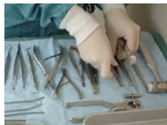
器具の使用頻度に応じて分別・整理