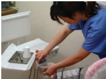
ユニットおよびユニット周囲の清掃