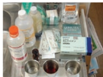
手術に使用する薬品や消耗品の準備