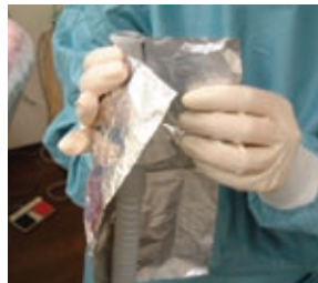
清潔領域・不潔領域の分別