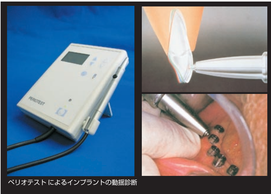
ペリオテストによるインプラントの動揺診断