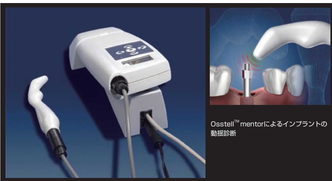
Osstell™ mentorによるインプラントの動揺診断